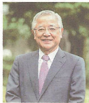
人生100年時代の健康管理