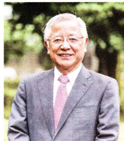
【プロフィール】広島県生まれ。1976年広島大学医学部卒業後、聖路加国際病院内科勤務。99年東京医科大学循環器内科主任教授。2020年5月から現職。総合内科専門医、日本循環器学会専門医、前日本循環器病予防学会理事長。