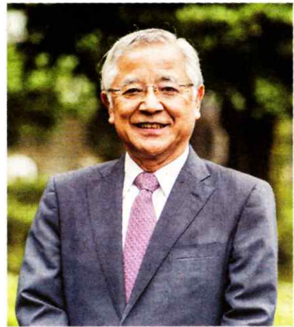
【プロフィール】広島県生まれ。1976年広島大学医学部卒業後、聖路加国際病院内科勤務。99年東京医科大学循環器内科主任教授。2020年5月から現職。総合内科専門医、日本循環器学会専門医、前日本循環器病予防学会理事長。