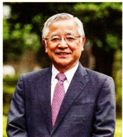
【プロフィール】広島県生まれ。1976年広島大学医学部卒業後、聖路加国際病院内科勤務。99年東京医科大学循環器内科主任教授。2020年5月から現職。総合内科専門医、日本循環器学会専門医、前日本循環器病予防学会理事長。