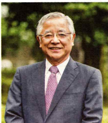
【プロフィール】広島県生まれ。1976年広島大学医学部卒業後、聖路加国際病院内科勤務。99年東京医科大学循環器内科主任教授。2020年5月から現職。総合内科専門医、日本循環器学会専門医、前日本循環器病予防学会理事長。

なる老化現象でしょうか。いわゆる加齢性難聴は両方の耳の聴力が少しずつ進行性に低下し、個人差が大きくなると報告があります(図)。祭りの太鼓、人の話し声、鳥の鳴き声以外の音が