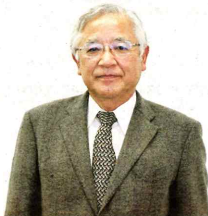
【プロフィール】 広島県生まれ。1976年広島大学医学部卒業後、聖路加国際病院内科勤務。99年東京医科大学循環器内科主任教授。2020年5月から現職。総合内科専門医、日本循環器学会専門医、前日本循環器病予防学会理事長。