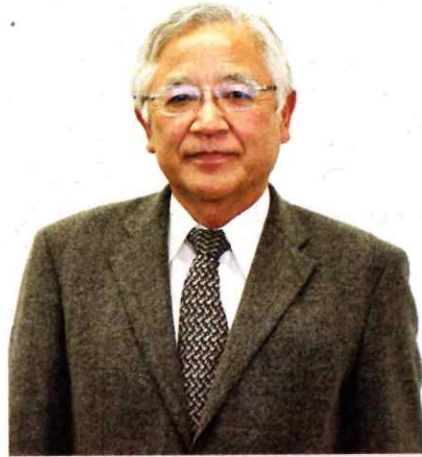
人生100年時代の健康管理 桐生大学短期大学部副学長 山科章

【プロフィール】広島県生まれ。1976年広島大学医学部卒業後、聖路加国際病院内科勤務。99年東京医科大学循環器内科主任教授。2020年5月から現職。総合内科専門医、日本循環器学会専門医、前日本循環器病予防学会理事長。